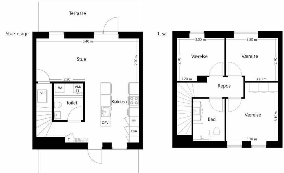
Type 101/105 m 2 – 2 plan

Vejledende tegninger uden ansvar. Det angivne areal vil muligvis afvige en smule fra det endeligt opmålte