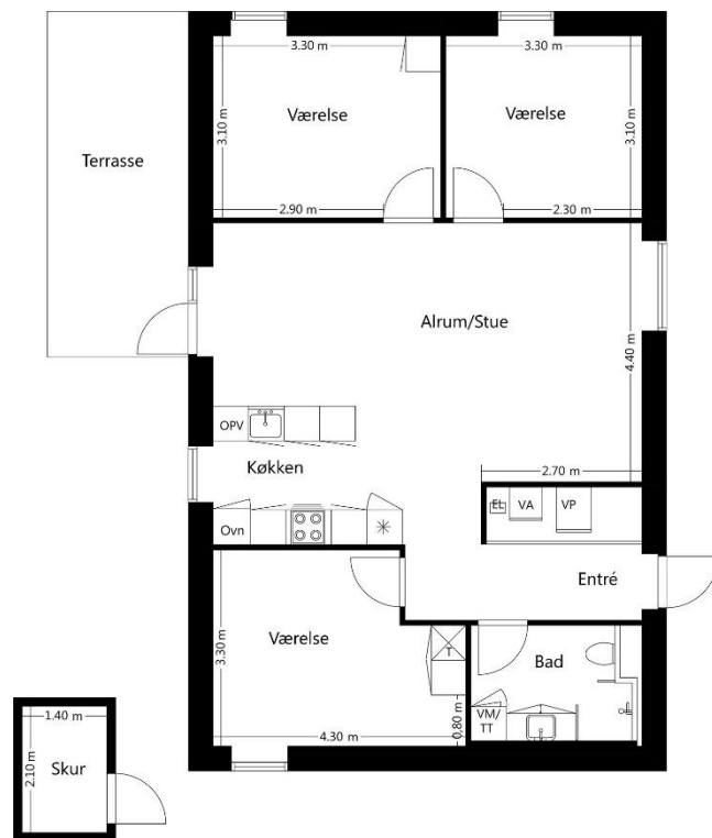
Type C - 110 m 2 Venstrevendt terrasse Venstrevendt køkken