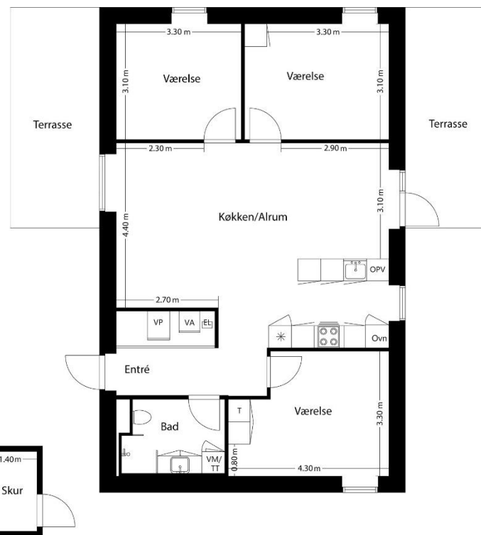
Type D - 110 m 2 Højre- og venstrevendt terrasse Højrevendt køkken

Vejledende tegninger uden ansvar. Det angivne areal vil muligvis afvige en smule fra det endeligt opmålte