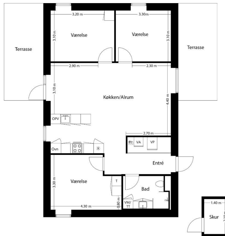
Type B - 110 m 2 Højre- og venstrevendt terrasse Venstrevendt køkken

Vejledende tegninger uden ansvar. Det angivne areal vil muligvis afvige en smule fra det endeligt opmålte